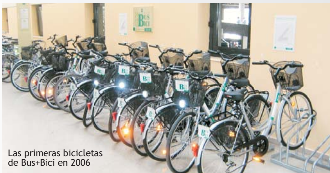
Las primeras bicicletas de Bus+Bici en 2006

Aquel proyecto de 2006 se ha convertido hoy, tres años después, en un servicio asociado al uso de nuestra tarjeta de transporte, que posibilita a la ciudadanía del área metropolitana que utilizan el transporte público disponer de una bicicleta pública para sus desplazamientos por Sevilla.